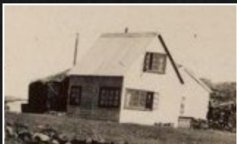
VINNUMAÐUR BANAR BARNSHAFANDI VINNUKONU BAKSÝNSSPEGILLINN 16 KÆFD MED VETTLINGI OG FLEYGT Í SVARTÁ