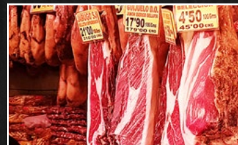
HIMINHÁTT MATARVERÐ HREKUR ÖRYRKJA ÚR LANDI NETTENDAMÁL 14 KJÖTIÐ FJÓRFALT ÓDÝRARA Á SPÁNI