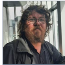
Steini „Nei, ekki svo ég viti. Alveg laus við fóbíur.“