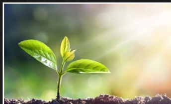
GARÐURINN - HAMINGJUREITUR HEIMILISINS FYLGIÐLAB FYLGIR MED MANNLÍFI