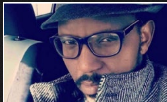
„ÉG ÆTLA EKKI AÐ ÞEYJA“ SAMFÉLAGIÐ 5 - DÆMDUR NAUÐGARI Á GÖTUM REYKJAVÍKUR